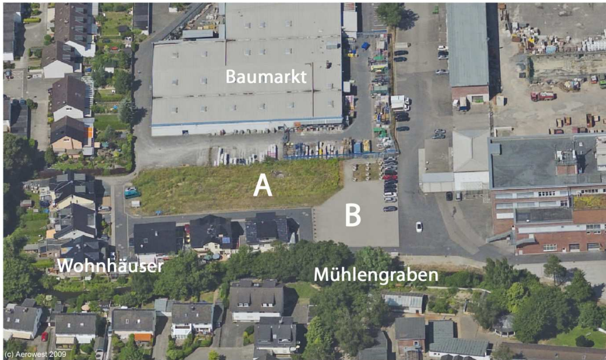
Abb. 2: Schrägluftbild

Im Bereich beider Flächen ist ein neuer, winkelförmiger Baukörper geplant, bestehend aus Stadthäusern, Geschosswohnungen und Büroflächen mit Gemeinschaftstiefgarage. Das Vorhaben soll einen Beitrag liefern, den in Siegburg vorhandenen Wohnraumbedarf zu decken. Die geplanten Büroflächen sollen den angrenzenden gewerblich genutzten Bereich kleinteilig abrunden.