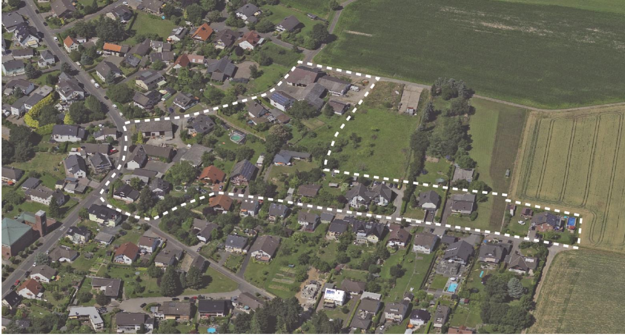
Luftbild aus dem Jahr 2013 (unmaßstäblich)