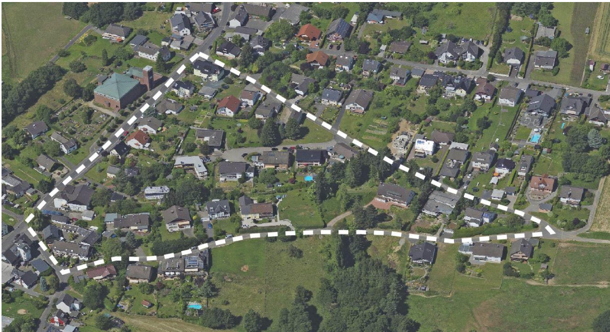
Luftbild aus dem Jahr 2013 (unmaßstäblich)

Das Plangebiet entlang der Straßen „Im Klausgarten“ wird überwiegend wohnlich genutzt und ist geprägt von größeren und kleineren Einfamilienhäusern mit Garagen und kleineren Nebenanlagen, Zweifamilienhäusern und teilweise auch Mehrfamilienhäusern. Entlang der „Braschoser Straße“ befinden sich mehrere Wohngebäude, eine Gaststätte und ein nicht störendes Gewerbe. Am Kreuztor befindet sich eine denkmalgeschützte Hofanlage mit mehreren, kleineren, aneinandergereihten Häusern. Sowohl eingeschossige, als auch zweigeschossige Gebäude mit geneigten Dächern befinden sich innerhalb des Plangebietes und zeigen den dörflichen Charakter des Gebietes. Besonders prägend für den Bereich ist auch die stark abfallende Topografie nördlich der Straße Im Klausgarten in Richtung Wahnbachtalsperre, im Südosten.