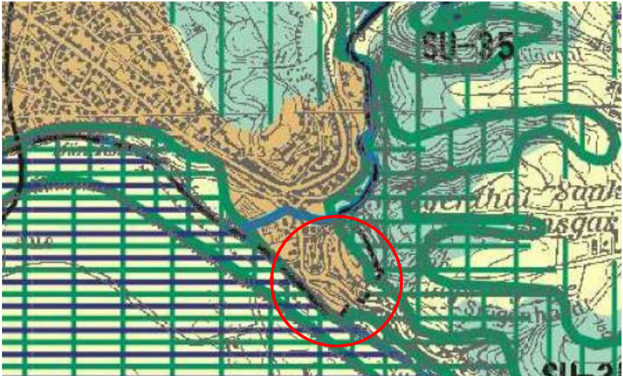
Abb. 3: Regionalplan