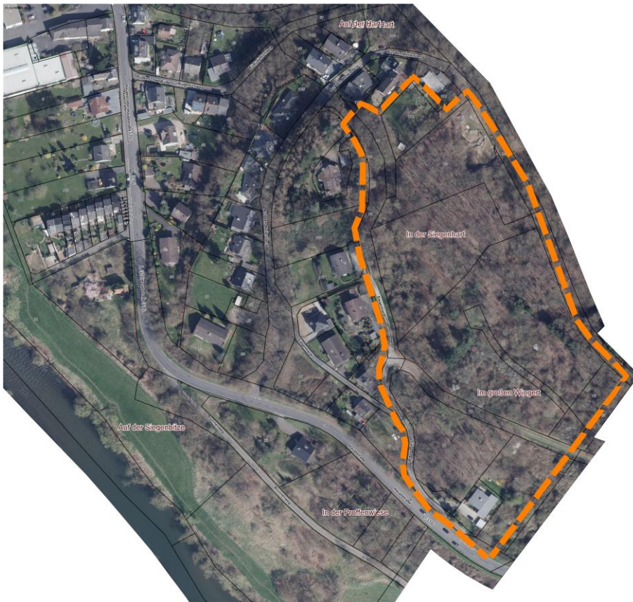
Abb. 2: Luftbild