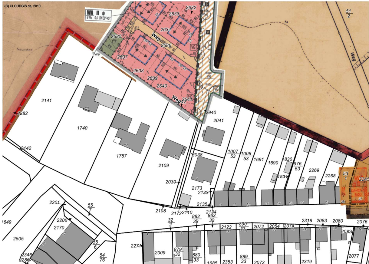
Abb. 2 – Bislang unbeplanter Bereich (weiße Flächen) und angrenzende Bebauungsplangebiete

Westlich und nördlich grenzen die Bebauungspläne Nr. 54/1 und 54/1, 1. Änderung aus den 1970er Jahren und der Vorhabenbezogene Bebauungsplan Nr. 55 aus dem Jahr 2003, östlich die Bebauungspläne Nr. 6/1 und 6/3 aus den 1960er Jahren, an das Plangebiet an.