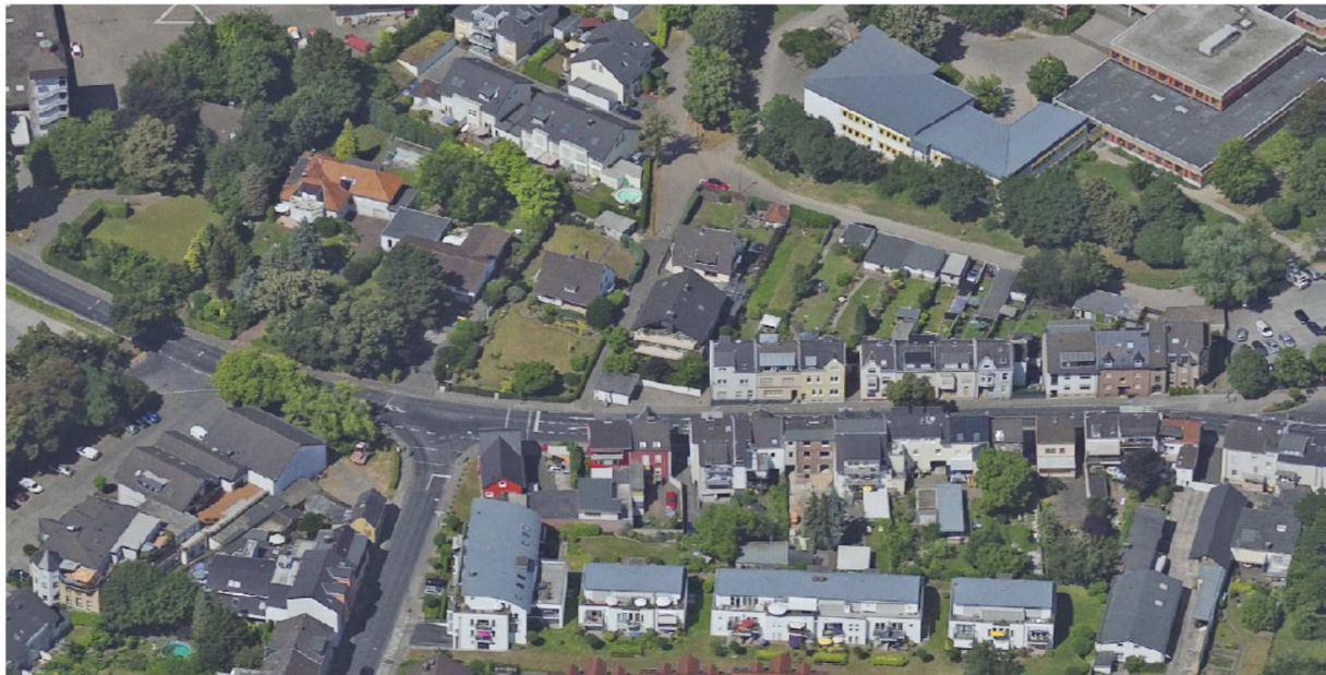
Abb. 3 – Schrägluftbild (2015)

Der Bereich entlang des Verbindungsweges zwischen der Wolsdorfer Straße und der Anna-Reuter-Straße, mittig des Plangebietes, wird durch zweigeschossige, freistehende Mehrfamilienhäuser geprägt. Die Wohnbebauung westlich des Weges wurde mit einer Gemeinschaftstiefgarage errichtet, die von der Wolsdorfer Straße aus angefahren wird.